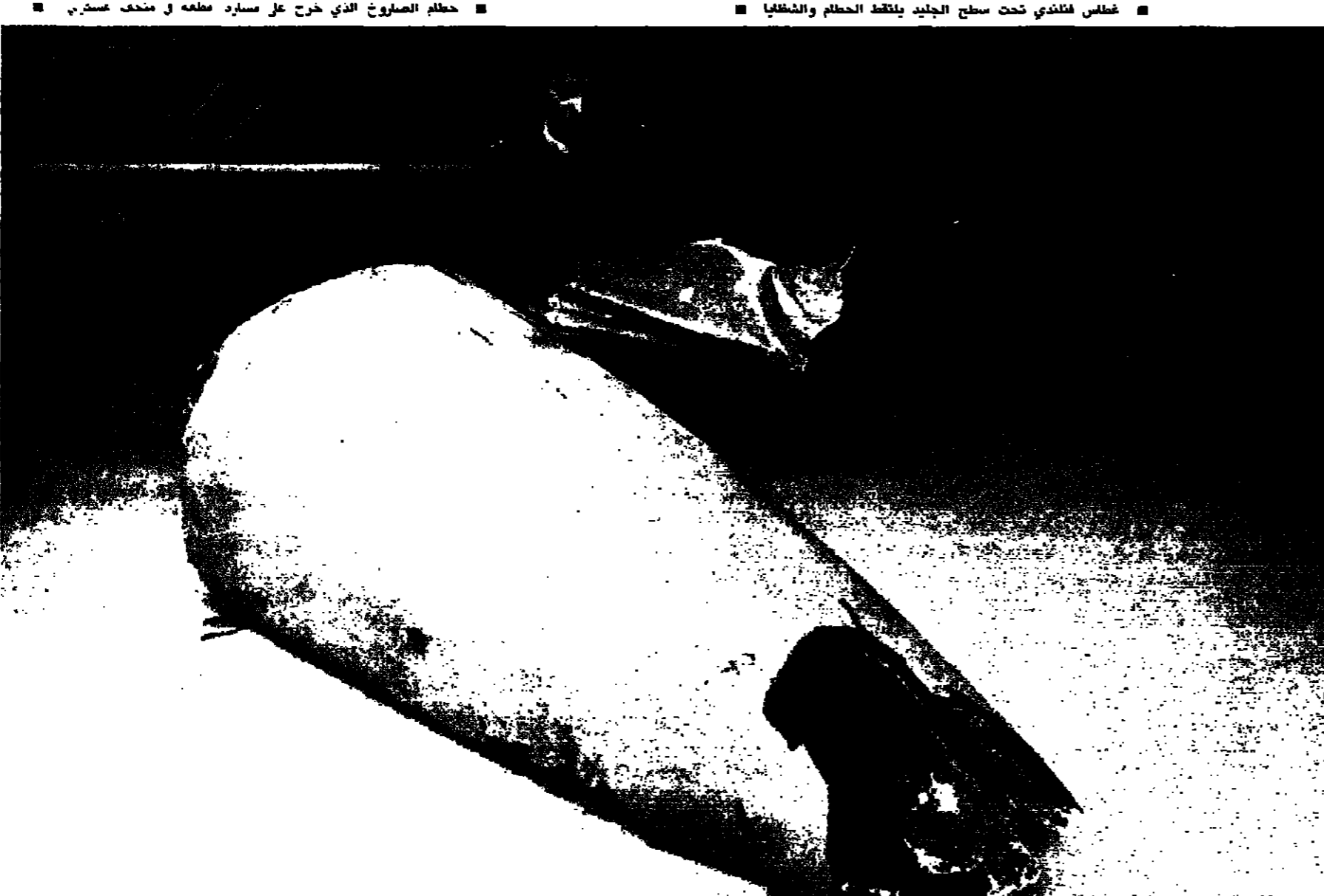
الحطام بحرسه رجل امن فنلندي قبل نقله الى موسكو

الخطاب مع اي حدث، مهما كان صغيرا - والحذر ذاته تطيقه في التعامل مع الاحداث الاردنية، خصوصا بعد اللقاء الاردني الفلسطيني وبلورة في الارض في مقال اعلاه السلام، واذا كان لفظ قد حدث في الخارج حول هذا الاطلاق، فلان الاخيرين اسلوبا فهم منطلقات الاطلاق ومرايمه، وديونا في ازالة اللبس والقوض حول هذا الاطلاق الذي نراه رهنا على المستقبل. وهنا نشدد على ان اي خطاب سياسي يفترض انتماء الى فضاء ثقافي وايدولوجي، واتصال في هذه القضية، اذا كان الخطاب السياسي العربي قد نجح في خلق قومية الاحساس والشعور السياسية، ام انه اكتفى بالتوقيف والتلقين؟ هذا هو الموضوع جوهر العمل الاعلامي الذي نشده لبلورة خطاب ارضي وعربي - انطلاقا من اشكليات الصراع العربي - الاسرائيلي ووصولا الى التعبدية الوطنية الواسعة وخلق لواء من الحظر والافتعال لدى المواطن ... هل نجحتم في هذا المشروع؟ يلا انه بعد بيروت - غابت معالم المختصر، الذي صهر الامم والسواعد في معركة لولوجية دائمة؟ وكنتي ارى في المواضع العربية الاخرى نوعا من العجز عن الجرح الاعلامي، والتعاطي مع الخصوميات الحثيثة - على الرغم من - التفتتات القومية ... لا اعتقدون ان الديمقراطية او الليبرالية هما الرثة التي يتنافس من خلالها الخطاب الاعلامي الذي هو سلاح في المعركة القومية؟